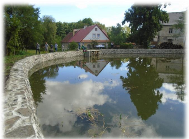
Rybník po opravě