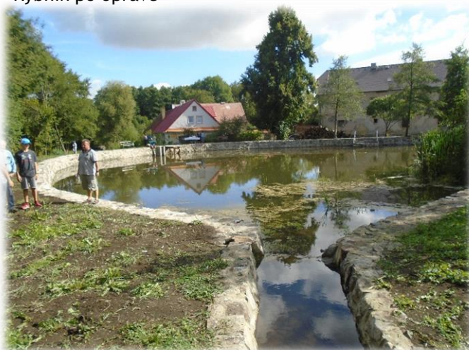
Rybník po opravě