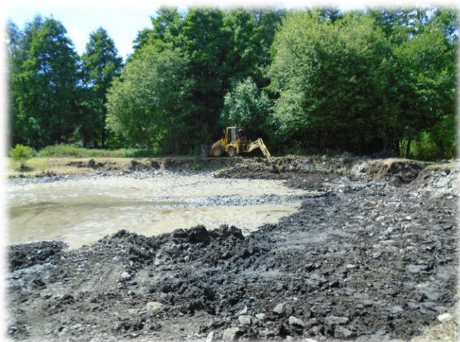
Rybník před opravou