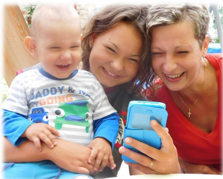
Text převzat z tisku Region Podbořanska