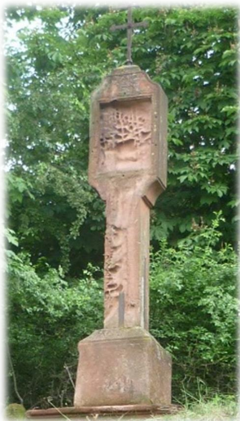
Foto před restaurováním

A teď již jen zbývá vybudovat do svahu od silnice schody, aby byla památka přístupná od silnice.