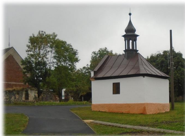
text a foto: Josef Lněniček