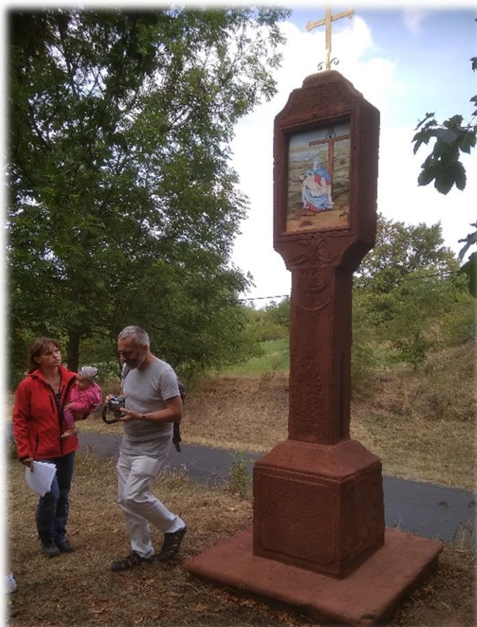
Foto po restaurování