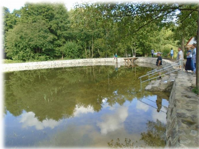
Rybník po opravě