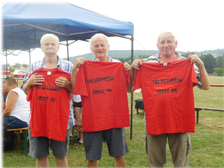
Text převzat z tisku Region Podbořanska